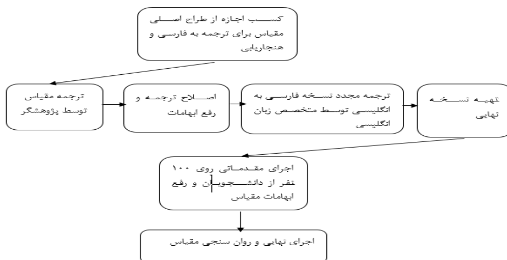
شکل ۱. نمودار مراحل بومی سازی و هنجاریابی مقیاس عاطفه پذیری ذهنی

مقیاس نهایی در اختیار سه نفر متخصص روان شناسی قرار داده شد و روایی محتوا از جهات درک سوالات مقیاس، ارزیابی دقیق از عاطفه پذیری ذهنی، ضرورت هر سؤال در مقیاس بر اساس روش والتز و باسل (Waltz & Bausell) در طیف های پنج عاملی (غیرمرتبط ۱، نیاز به بازیابی اساسی ۲، مرتبط اما نیاز به بازیابی ۳، و کاملاً مرتبط ۴) مورد بررسی و تأیید قرار گرفت. قبل از اجرای اصلی نسخه آماده شده به منظور دریافت بازخورد از شرکت کنندگان درباره دستورالعمل پرسش نامه، درک محتوای گویه های مقیاس و رفع ایرادهای احتمالی در گویه ها، مطالعه مقدماتی روی ۱۰۰ نفر از دانشجویان که به صورت نمونه برداری در دسترس انتخاب شده بودند، اجرا و ضعف های موجود برطرف شد. در مرحله آخر و پس از نهایی کردن فرم اصلی، نمونه پژوهش با مقیاس عاطفه پذیری ذهنی مورد ارزیابی قرار گرفتند. جهت سنجش دقیق میزان اعتبار ابزار ترجمه شده، روایی و پایایی آن مورد بررسی قرار گرفت. به منظور بررسی روایی ابزار ترجمه شده از روایی سازه بهره گرفته شد و جهت سنجش پایایی ابزار از ضریب آلفای کرونباخ استفاده گردید. به منظور سنجش روایی سازه ابزار ترجمه شده با بهره گیری از معادلات ساختاری و تحلیل عاملی تأییدی، روایی سازه آن نیز با استفاده از نرم افزار Smart-PLS مورد بررسی قرار گرفت. مراحل بومی سازی و هنجاریابی مقیاس در شکل ۱ گزارش شده است.