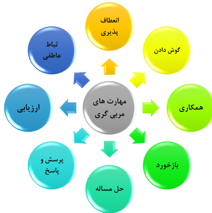
تصویر ۲: مؤلفه های مهارت مربی گری