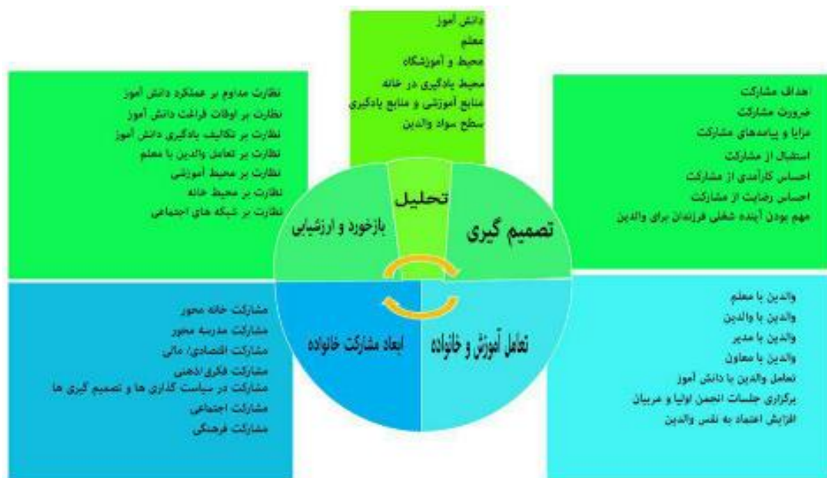
شکل ۲. الگوی روندی پیشنهادی مشارکت والدین