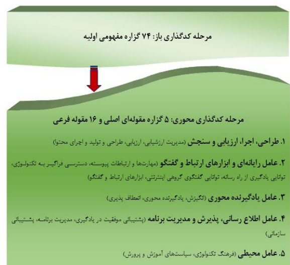
شکل ۳. فرایند مدیریت داده‌ها و تکامل مدل در دو مرحله کدگذاری باز و محوری

پس از انجام مصاحبه تا مرحله اشباع و استخراج مقولات، در نهایت ۷۴ مقوله مفهومی اولیه، ۱۶ مقوله فرعی و ۵ مقوله اصلی به دست آمد. جزئیات مقولات به دست آمده در اشکال شماره ۳ یعنی کدگذاری داده‌ها و شماره ۴ یعنی الگوی عوامل تأثیرگذار بر اجرای دوره‌های موک، و مقوله بندی‌ها در قالب جدول ۳، نشان داده شده است.